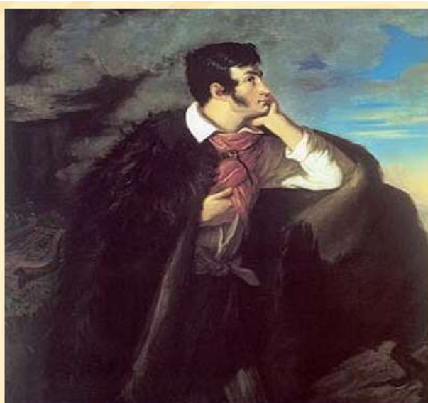
Walenty Wańkowicz, Portret Adama Mickiewicza na Judahu skale , 1827–1828, olej na płótnie, 148 cm × 123 cm

Po upadku powstania listopadowego polscy twórcy próbowali znaleźć odpowiedź na pytanie, jakie były przyczyny klęski. Ponieważ czuli się duchowymi przywódcami narodu, pragnęli też pocieszyć swoich rodaków. Powstał wówczas, opublikowany w Paryżu w 1834 roku, Pan Tadeusz , któremu nadano miano polskiej epopei narodowej.